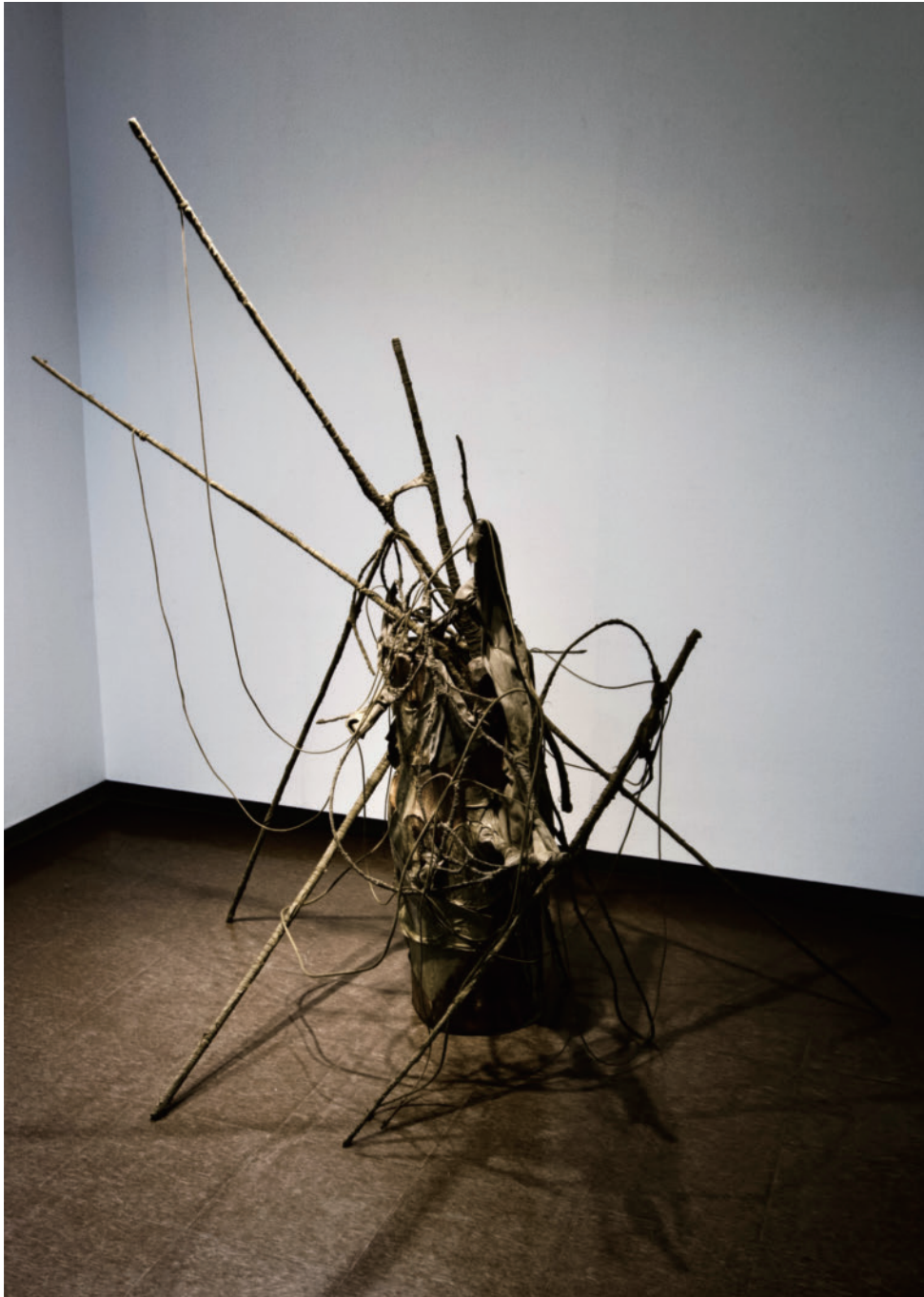
「無題」（個展「相依性」より，らいらっくギャラリー，札幌，2021）道銀文化財団助成事業 「Untitled」（Excerpt from Solo Show Soesho (Inter-dependence) Lilac gallery, Sapporo, 2021) Dogin cultural foundation grant