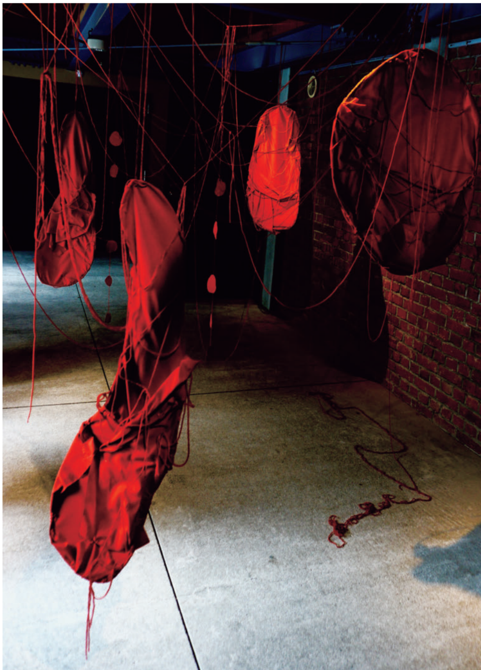
「出逢う」 インスタレーション, ミクストメディア (第8回春待つ北の雛飾り, ふれあい倉庫, 当別町 2021) 「Encounter」 Installation, Mixed Media, 8 th Harumatsu kitano hinakazari Festival, Fureai soko, Tobetsu, 2021