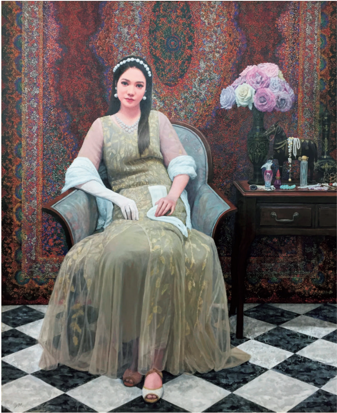
「ミズ、フォックス」 Ms. Fox F130号 油彩×キャンバス 2021年作 第107回光風会展