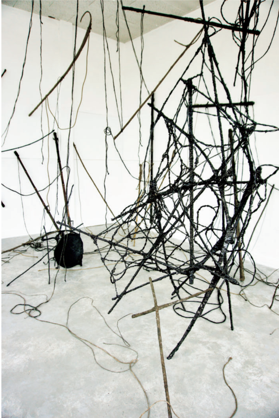
「交差」 インスタレーション, ミクストメディア, スタジオ Y, 当別町, 2021