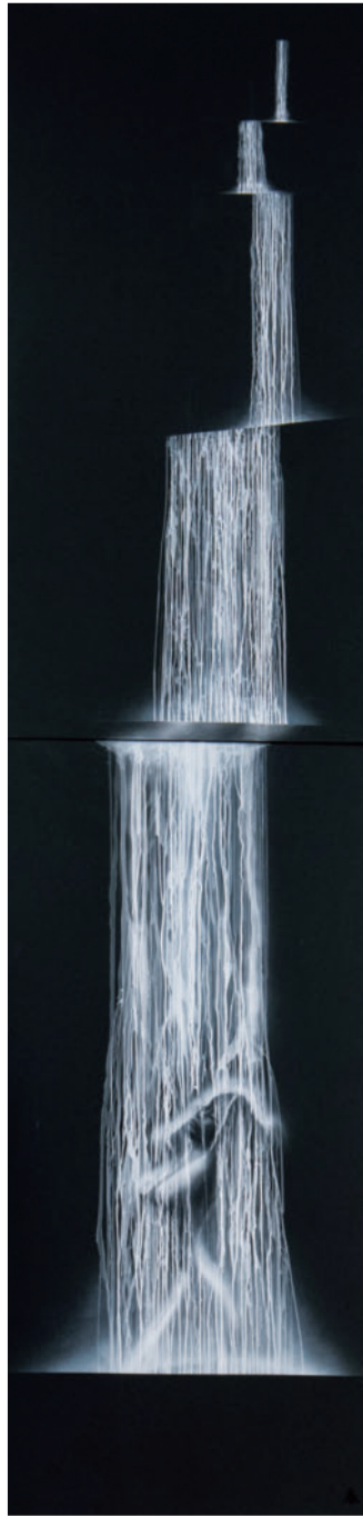
「滝と女神」 Waterfall and goddess 150号 M / ガッシュ / 板に紙貼り / 2021年 / 第50回札幌文化団体協議会