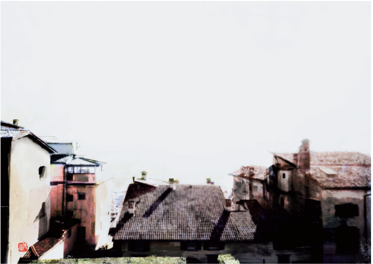
「Passeggiare」 フリーペーパーのためのイラストレーション

画材：アクリルガッシュ+Clip Studio Paint サイズ：11465 p×8110 p