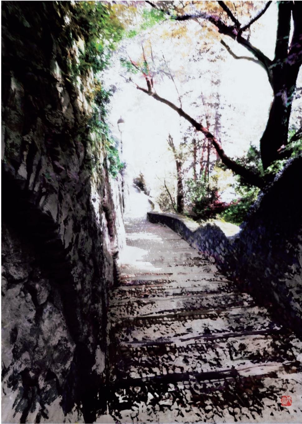
「Passeggiare」 フリーペーパーのためのイラストレーション

画材：アクリルガッシュ+Clip Studio Paint サイズ：8110 p×11465 p